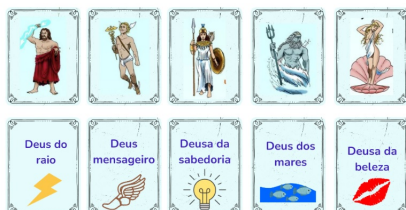
Figura 2 - Jogo da memória mitológico

Nessa etapa, a ideia é apresentar para a turma alguns aspectos da cultura greco-romana e sua influência na arte, na literatura etc. Para este encontro, a aula seria dividida em dois momentos: primeiro, teríamos uma aula expositiva e dialogada, abordando as temáticas citadas anteriormente, com o auxílio de datashow , slide e quadro branco como recursos didáticos. No segundo momento, seria realizado um jogo da memória como recurso auxiliar, pretendendo, assim, consolidar o conteúdo apresentado na aula expositiva. Na figura 2, é possível visualizar algumas cartas do jogo que produzimos: