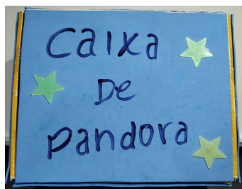
Figura 1 - Caixa de Pandora para Contação de História

No primeiro encontro da oficina, ocorre a apresentação do projeto, bem como uma atividade diagnóstica, para coletar informações sobre o que os estudantes conhecem acerca da mitologia grega. A partir dessa sondagem, segue-se a primeira proposta didática, a qual intitulamos como “Caixa de Pandora para Contação de História”, conforme vemos abaixo: