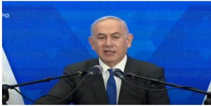
Primeiro ministro Benjamin Netanyahu

Na Etiópia, Lula afirmou que “o que está acontecendo na Faixa de Gaza não é uma guerra, mas um genocídio” e fez referência às ações do ditador nazista Adolf Hitler contra os judeus.