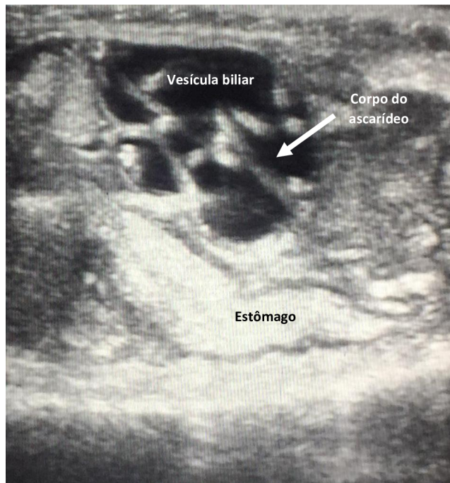
Figura 3. Presença de ascarídeos no interior da vesícula biliar .

Durante o exame necroscópico, verificou-se que o animal possuía várias larvas de ascarídeo no tecido subcutâneo (Figura 4A), o pericárdio estava espessado (Figura 4B); presença de ascarídeos vivos entre o parênquima hepático e a cápsula hepática que apresentava-se espessada (Figura 4C e 4D); mucosa do esôfago espessada com presença de ascarídeos vivos; ascarídeos vivos presentes no estômago; mucosa do intestino espessada com grande quantidade de ascarídeos vivos (Figura 4E e 4F); parede da vesícula biliar espessada com presença de um ascarídeo vivo em seu interior (Figura 4G); presença de parasitos nos folículos ovarianos (Figura 4H); parênquima renal atrofiado, hipocorado e com cápsula espessada; presença de ascarídeos nas adrenais; grande quantidade de cistos e de larvas na gordura celomática; presença de ascarídeos no celoma e na musculatura.