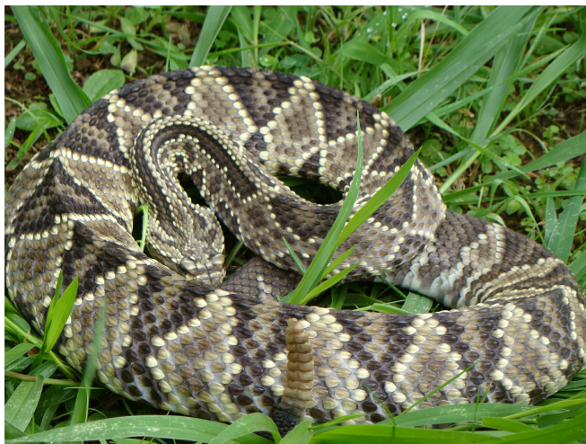
Figura 1. Crotalus durissus .

possui ampla distribuição geográfica. No Brasil, ocorre apenas uma espécie desse gênero, a Crotalus durissus , com 8 subespécies registradas (Uetz, 2016) que habitam os cerrados do Brasil central, as regiões áridas e semiáridas do Nordeste, os campos e áreas abertas do Sul, Sudeste e Norte (Melgarejo, 2009). O seu veneno possui atividades neurotóxica, miotóxica e coagulante (Jorge & Ribeiro, 1992; Mello et al, 2017) e somente o tratamento soroterápico específico é eficiente no tratamento dos acidentes ofídicos. Os acidentes ofídicos representam um problema de saúde pública nos países tropicais, sendo consideradas doenças negligenciadas pela World Health Organization (WHO, 2016). No Brasil são registrados 20.000 acidentes ofídicos por ano (SINAN, 2018) e embora o gênero Crotalus seja responsável por apenas 10% dos acidentes, é o veneno que causa a maior taxa de letalidade, por volta de 1,0% (SINAN, 2020).