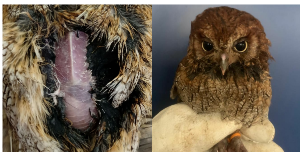
Figura 7. Hepatomegalia em 09/02. ZWARG, 2021. Figura 8: identificação do animal. SILVESTRE, 2021.