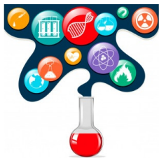
Figura 1 - Representação da Ciência

Nossa análise se inicia a partir da localização de uma regularidade icônica recorrente, que inscreve a imagem do saber nominalizado “Ciência”. Essa regularidade histórica de uma imagem que opera uma memória social funciona como uma síntese de representação imagética, tal qual se pode observar na imagem de que nos valem a seguir: