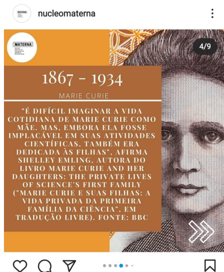
Figura 1 - Postagem 18 de abril de 2021 do Núcleo Virtual de Pesquisa em Gênero e Maternidade

Frederici (2019) afirma que o trabalho doméstico historicamente atribuído às mulheres é parte de uma engrenagem de opressão que dissemina a submissão feminina e o trabalho do cuidado não remunerado, o que provoca dissensos em relação a divisão de tarefas domésticas e vai ao encontro da descaracterização dos trabalhos que se voltam para o cuidado como de professoras da educação infantil, do ensino fundamental e do médio que, na sua maioria, estudam em cursos de humanas.