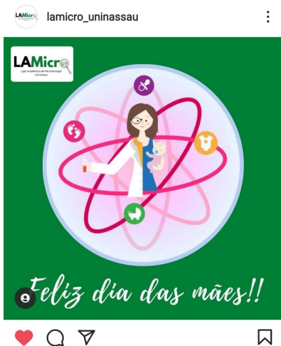
Figura 5 - Postagem do dia 9 de maio de 2021, pela Liga Acadêmica de Microbiologia da UNINASSAU

A figura 3 traz elementos imagéticos diversos, junto com os enunciados "Ciência, maternidade e pandemia - a realidade de três cientistas mães em meio a Covid-19" acompanhada de três imagens, uma delas está em vermelho, entendemos ser a representação de um vírus ou bactéria, a outra é uma mulher segurando um bebê e a terceira trata-se de uma mulher olhando em um microscópio. Logo, podemos afirmar que os implícitos são dados a ver quando colocados numa série, o que significaria dizer que ao mostrar a regularidade dos elementos que se referem a área como exatas, biológicas ou ainda as STEMs, notamos que a o sentido caminha para sedimentar o estereótipo da cientista enquanto aquela que usa jaleco ou faz uso de um microscópio.