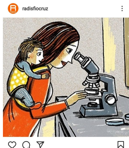
Figura 2 - Postagem 28 de janeiro de 2021 do programa RADIS de Comunicação e Saúde Fiocruz

carrossel de imagens nas postagens nas redes sociais), a que selecionamos para nossa reflexão, traz ao fundo o rosto sério da cientista e mãe Marie-Curie que não só foi a primeira ganhadora do Prêmio Nobel como conseguiu repetir o feito em razão da descoberta da radioatividade, o discurso verbal colocado a frente de seu rosto traz um quadro com a data de nascimento e morte "1867 - 1934" seguido de: "É difícil imaginar a vida cotidiana de Marie Curie como mãe. Mas, embora ela fosse implacável em suas atividades científicas, também era dedicada às filhas (...)", há, portanto, a produção de efeito de sentido pelo uso do conectivo "embora" que, numa primeira leitura, entendemos como uma mulher que era excelente no seu trabalho conseguia também cuidar das filhas, outra possibilidade interpretativa é a de que mesmo sendo cientista, ela também conseguiu cuidar das filhas. Ademais, a questão central aqui é o fato da postagem trazer Marie-Curie, mulher, mãe e cientista do campo das ciências exatas. Diante do que nos trouxeram os algoritmos, essa postagem, tal como outras, traz a imagem de uma cientista de importância singular para os estudos sobre radioatividade, há um suposto apagamento da imagem das cientistas em outras áreas como aquelas que também teriam grandes feitos.