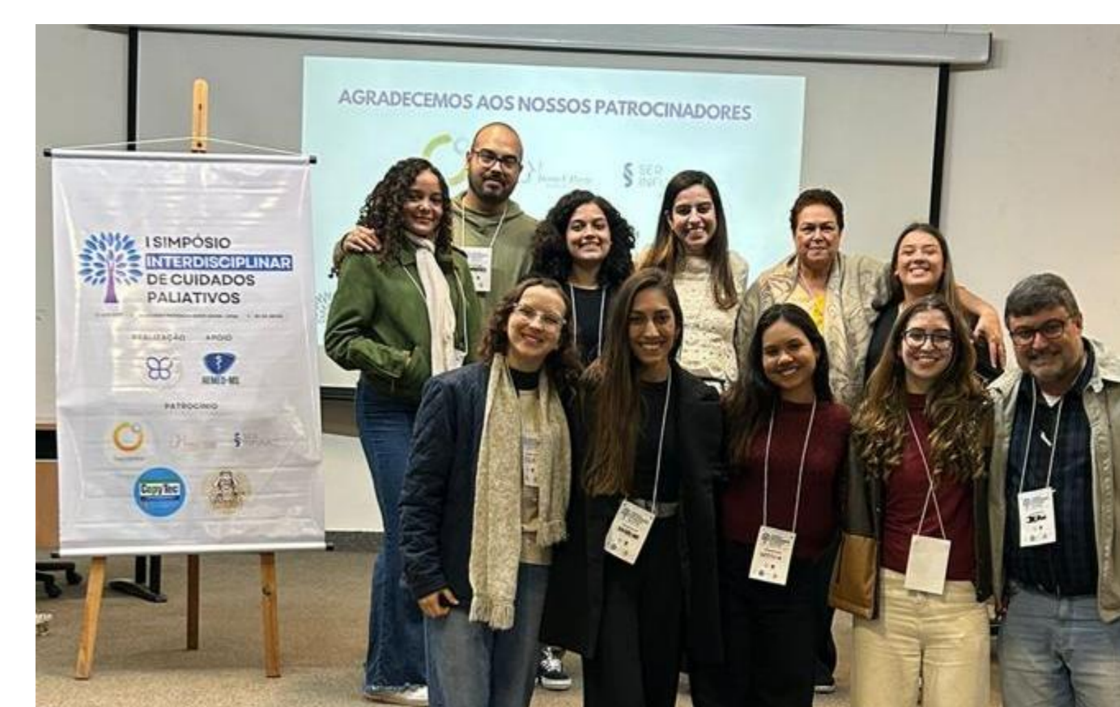
Figura 2: Comissão organizadora do Simpósio junto de dois palestrantes

A visibilidade da LACP no cenário das Ligas Acadêmicas aumentou significativamente após a realização do Simpósio, o que pôde ser verificado devido à grande repercussão do evento nas redes sociais da Liga - com o intenso compartilhamento de fotos e vídeos do evento, além do largo crescimento do número de seguidores - e à participação expressiva de estudantes de outras instituições, não apenas da UFMS, bem como de um grupo de profissionais vindos do interior do estado.