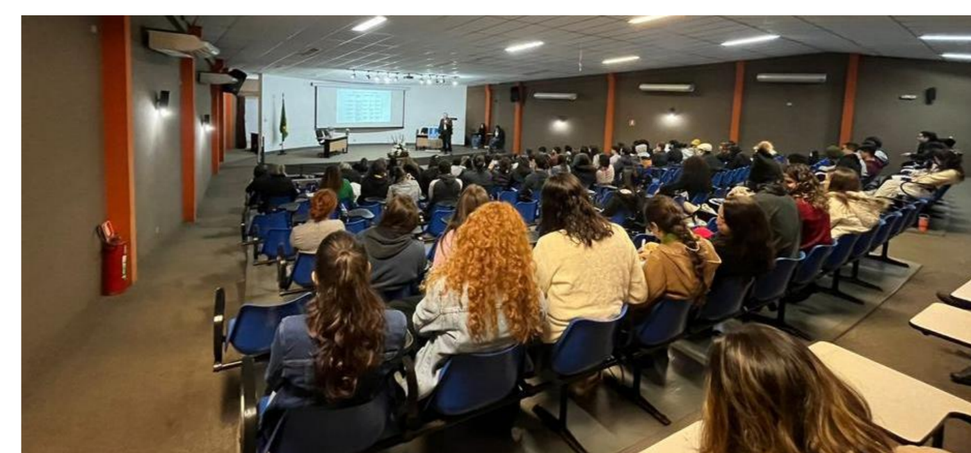
Figura 1: Participantes do evento durante palestra

Em relação aos profissionais, foram 31 participantes (24,2%), incluindo um grupo vindo do interior do estado (Aquidauana-MS). A distribuição dos cursos de formação foi mais equitativa como ilustra o Gráfico 2.