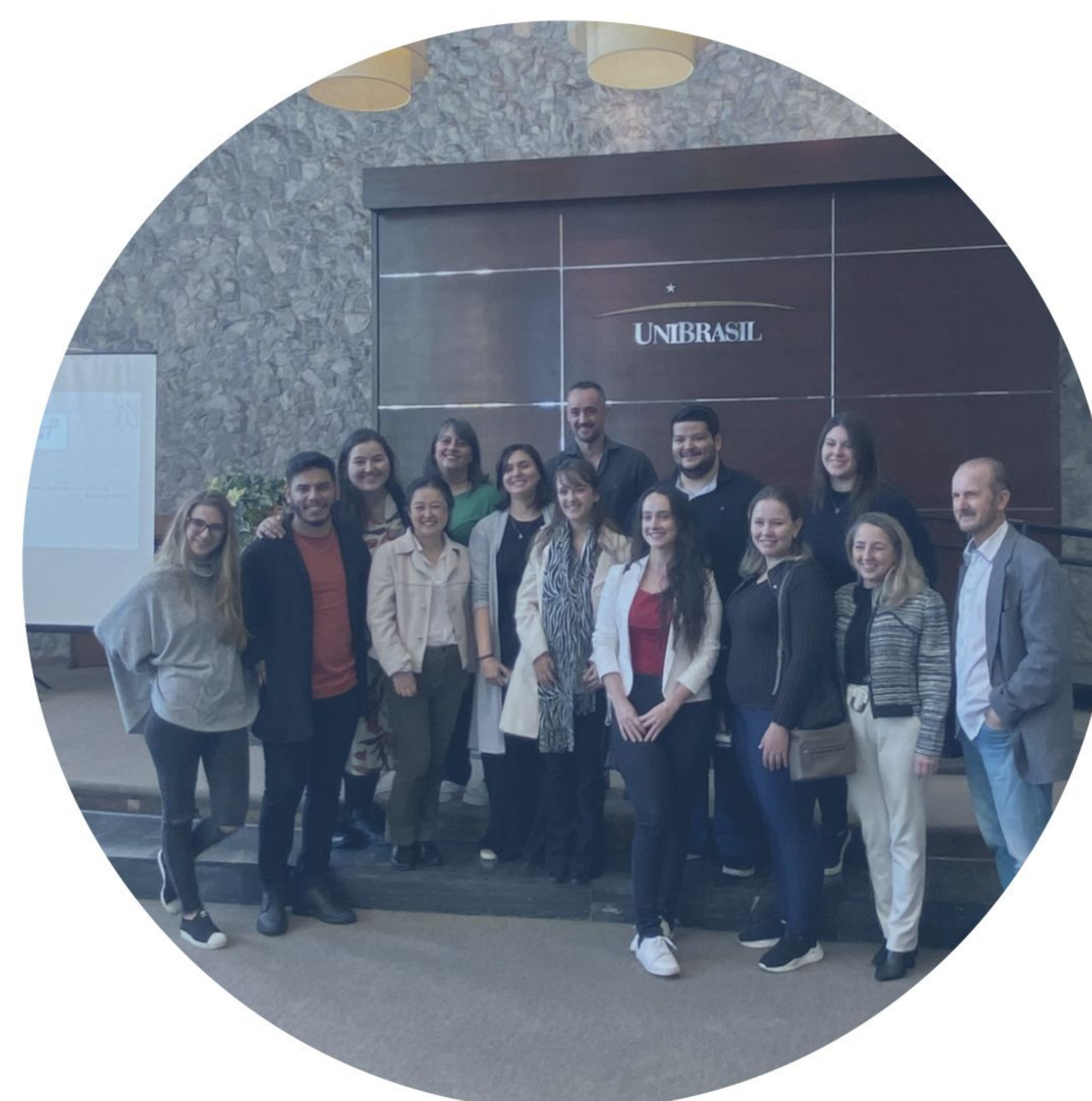
Imagem 1. Diretoria da LACP + equipe multidisciplinar do Hospice/ 2023