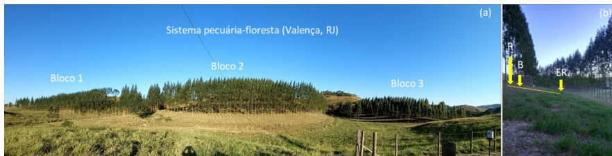
Figura 1. Vista geral do experimento (a) e dos locais de coleta de amostras de solo (R: renque; B: borda e ER: entre renque) - Crédito Fabiano de Carvalho Balieiro, Embrapa Solos.

A coleta de solo se deu nos terços superior, médio e inferior das encostas, em dezembro de 2022 e janeiro de 2023, entre o 35º e 40º meses de idade do plantio, descartando os renques superior e inferior de cada bloco. Em cada terço foram coletadas amostras compostas (3 simples) nas profundidades de 0-10cm, 10-20cm e 20-40cm e em três distâncias dos troncos (renque, borda (cerca de 2,0 m do renque e no entre renque, a cerca de 7,5m de distância dos renques adjacentes) (Figura 1). As amostras foram secas ao ar, peneiradas a 2mm e acondicionadas em sacos plásticos. Para fins de análise química e isotópica as subamostras foram finamente moídas com auxílio de pistilo e gral, até textura de talco. Posteriormente foram encaminhadas para Laboratório de Biotransformação de Carbono e Nitrogênio (LABCEN) da Universidade Federal de Santa Maria (UFSM), Santa Maria/RS para determinação do C total (g kg -1 ) pelo analisador elementar e da abundância natural do 13 C (em ‰). A abundância de 13 C nas amostras de solo é expressa como \delta^{13}\text{C} , que é uma medida que se refere a um padrão expresso em partes por mil: (amostra 13 C/ 12 C - padrão 13 C/ 12 C) \delta^{13}\text{C} (‰) = x 1.000. O padrão internacional é V-PDB (Vienna-Pee Dee Belemite).