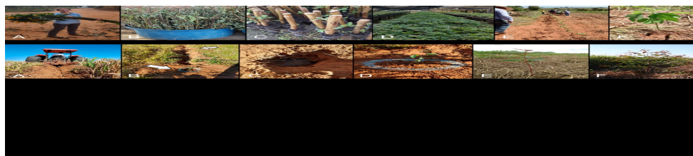
Figura 2. Etapas da obtenção, produção e plantio de mudas de Tithonia diversifolia . A - localização e corte do material vegetativo nos arredores da cidade de Bauru - SP. B - material vegetativo depositado em caixas d'água com a parte inferior submersa para a manutenção da umidade até que fossem processados pelos funcionários do viveiro. C - Estacas já processadas e plantadas em tubetes, mantidas em estufa. D - Mudanças já em desenvolvimento mantidas na parte externa do viveiro com nível de sombreamento sendo gradativamente reduzido até plena exposição ao sol. E - Processo de plantio com a equipe de trabalhadores. F - Muda já estabelecida após finalização do plantio.

Foram feitas duas tentativas para implantar arbustos. Na primeira, sementes foram processadas, tratadas termicamente e levadas ao canteiro de germinação, seguindo o recomendado por AGBOOLA; IDOWU e KADIRI (2006). Na segunda, estacas de T. diversifolia foram coletadas, tratadas com ácido indolbutírico e cultivadas em tubetes por 8 semanas em estufa, antes de serem aclimatadas externamente (Fig. 2, A-D). O plantio ocorreu em dez/2021, com 96 linhas preparadas manualmente (Fig. 2, E e F), incluindo replantio de 4 renques em fev/2023 com estacas da própria área.